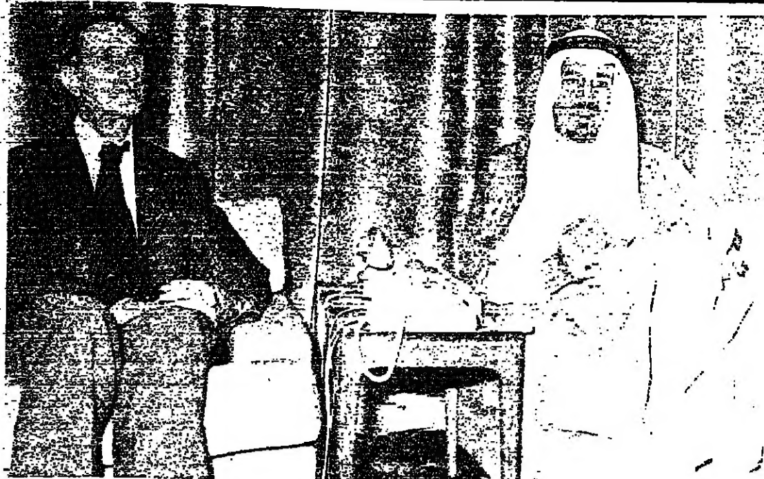
■ مع الملك خالد في أيار ٧٤ ■